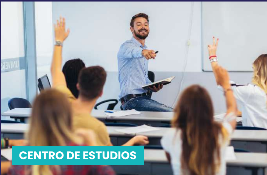
CENTRO DE ESTUDIOS